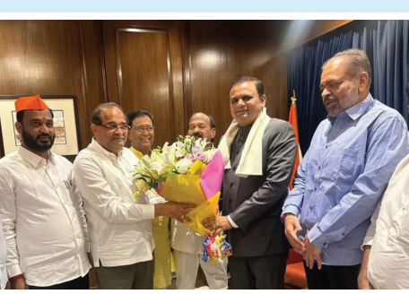
महाराष्ट्रातील तमाम १२ कोटी जनतेच्या वतीने राहुल नार्वेकर यांचे अभिनंदन करतो. महाराष्ट्रात काही अपवाद वगळता सातत्याने विरोधीपक्ष नेत्याची निवड बिनविरोध करण्याची परंपरा विरोधीपक्षाने राखली आहे. याचा मान राखत आपल्या निवडीला पूर्ण समर्थन दिल्याबद्दल विरोधीपक्षाच्या सर्व सदस्य आणि गटनेत्यांचे आभार मानतो, असेफडणवीस म्हणाले. मी पुन्हा येईन, असे तुम्ही म्हणाला नव्हतात. पण तरीही आपण परत आलात, याचा उर्वरीत पान ३ वर

महाराष्ट्र विधानसभेच्या अध्यक्षपदी राहुल नार्वेकर यांची फेरनिवड झाली. बिनविरोध निवडीनंतर मुख्यमंत्री देवेंद्र फडणवीस यांनी अभिनंदन प्रस्तावावेळी नार्वेकरांची चौफेर तारीफ केली. मी पुन्हा येईन, असं तुम्ही म्हणाला नव्हतात. पण तरीही आपण परत आलात, याचा आनंद असल्याचे फडणवीस म्हणाले. नाना पटोलेचे विशेष आभार, तुम्ही वाट मोकळी केल्यामुळे मागच्या वेळी ते अध्यक्ष बनू शकले, असा टोलाही फडणवीसांनी लगावला. फडणवीस काय म्हणाले? विधानसभेचे सर्व सदस्य आणि