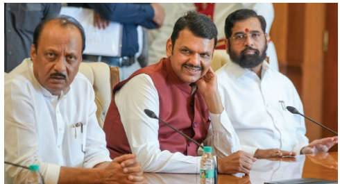
मंत्रिमंडळ विस्तार आणि खातेवाटप अंतिम होण्यापूर्वी मुख्यमंत्री देवेंद्र फडणवीस यांच्याकडून शिवसेना आणि राष्ट्रवादी काँग्रेस पक्षाशी बैठक करून मंत्रिपदाबाबत अंतिम तोडगा काढण्याचा प्रयत्न केला जाणार आहे. रविवारी रात्री १२ वाजता मुख्यमंत्री देवेंद्र फडणवीस यांनी वर्षा निवासस्थानी जाऊन उपमुख्यमंत्री एकनाथ शिंदे यांच्याशी शिवसेनेच्या जागांबाबत चर्चा केली. आज राष्ट्रवादी काँग्रेस पक्षासोबत रात्री उशिरा मुख्यमंत्री देवेंद्र फडणवीस चर्चा करणार असल्याची उर्वरीत पान ३ वर

महायुती सरकारचा शपथग्रहण सोहळा आणि आमदारांनी शपथग्रहण केल्यानंतर आता सगळ्यांना मंत्रिमंडळ विस्ताराचे वेध लागले आहेत. या पार्श्वभूमीवर महायुतीच्या गोटातून एक महत्त्वपूर्ण माहिती समोर आली आहे. त्यानुसार, येत्या १४ तारखेला महायुती सरकारचा मंत्रिमंडळ विस्तार होण्याची दाट शक्यता आहे.