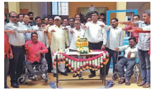
फलक लावून, जिगल्स वाजवून मतदारांमध्ये जनजागृती केली जात आहे.