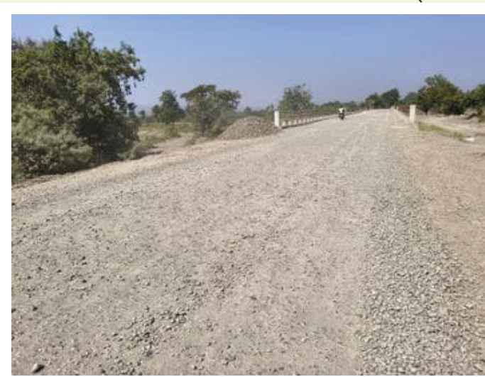
मागणी होती. परंतु, यंदा निवडणुकांपूर्वी पुलाच्या कामाला गती मिळाल्याचे पहायला मिळाली.

वांबोरी-शॅंडी जिल्हामार्गातील पिंपळगाव माळवी तलावावर वेगाने चार कोटींच्या पुलाचे काम करण्यात आले. असून वाहतूक खुली करण्यात आली. परंतु, पुलावर केवळ मुरुम टाकून बोलवण करण्यात आल्याने, हा पुल अपघाताला निमंत्रण देणारा ठरत आहे. नवीन आमदारांच्या हस्ते, उद्घाटनासाठी या पुलाचे पुढील काम सार्वजनिक बांधकाम विभागाने थांबवल्याची चर्चा आहे.