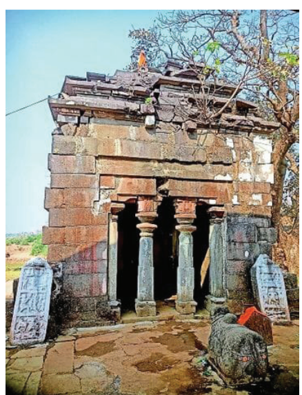
व देण्यांमधून तयार झाल्याचे शिलालेखांमधून आढळते. लेणी कोरण्याची कला महाराष्ट्रात १००० ते १२०० वर्षे जोपासली गेली.

अगदीच जवळ जाऊन पाहिल्यानंतर या ठिकाणी लेणी असल्याचे जाणवते. लेणी म्हणजे दगडात कोरलेले विवर होय. भारतातील सर्व लेण्या या लोहयुगात तयार करण्यात आल्या आहेत. भारतात आतापर्यंत १२०० लेण्या सापडल्या असून, त्यापैकी ८०० बुद्ध लेण्या आहेत, तर एकद्वया जुन्नर तालुक्यात ३५० लेण्या आहेत. या लेण्यांमध्ये काही जैन, तर काही बुद्ध लेण्या आहेत. जुन्नर तालुक्यात सर्वात पहिली खोदलेली लेणी ही तुळजा लेणी आहे. या सर्व लेण्या राजे, महाराजे यांनी दिलेल्या दान