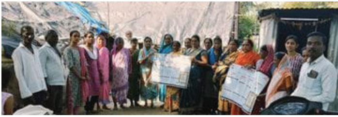
श्रीगोंदा : प्रतिनिधी

तालुक्यातील लोणी व्यंकनाथ येथे मतदानाबाबत निर्धार सत्र पार पडले. बैठकीत सर्वानुमते लोकप्रतिनिधींनी आधी आमची विकासकामे करावी, मगच मतदान करू अन्यथा मतदानावर बहिष्कार घालण्याचा इशारा आदिवासी नागरिकांनी दिला आहे.