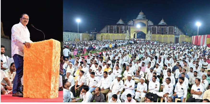
शिरूर : प्रतिनिधी

लोणीकंद येथे निर्धार मेळाव्यातून घोषणा । निर्धार मेळाव्याला जनतेचा प्रचंड प्रतिसाद