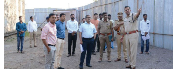
अकोले : प्रतिनिधी