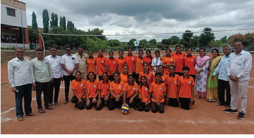
पारनेर पब्लिक स्कुलच्या संघांनी हॉलीबॉल व बास्केटबॉल स्पर्धेत तालुकास्तरावर यश संपादन केले.