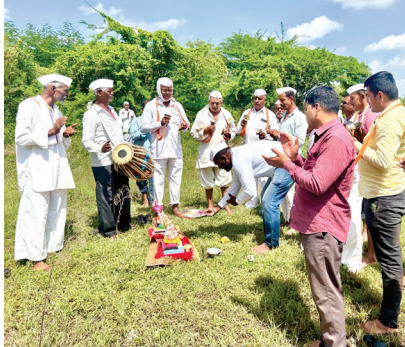
सर्वजनिक गणेशोत्सवादरम्यान विविध स्पर्धा घेण्यात आल्या. यादरम्यान गावातील मुलांनी सहभाग नोंदविला. ग्रामस्थांनी हिरीरीने सहभागी होत गणेश उत्सवात रंगत वाढवली.

सुपा : प्रतिनिधी पारनेर तालुक्यातील आपधूप येथे मंगळवार दि. १६ रोजी मोठ्या भक्तिभावाने सामुदायिक गणेश विसर्जन करून गणपती बाप्पाला निरोप देण्यात आला. चालू वर्षी खरीप हंगामात पावसाने जोरदार हजेरी लावली असल्याने ओढे, नाले, केटीवेअर, तळे, विहिरी पूर्ण क्षमतेने भरलेल्या आहेत. पाऊस पाणी भरपूर असल्याने तालुक्यात या वर्षी गणपती बाप्पाचे मोठ्या उत्साहात स्वागत करण्यात आले. दहा दिवस विविध स्पर्धा, सांस्कृतिक कार्यक्रम, धार्मिक कार्यक्रमांचे आयोजन करण्यात आले. आपधूपमध्ये