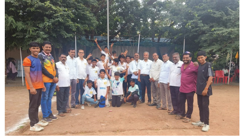
तालुकास्तरीय क्रिकेट स्पर्धेत श्री मुलिकादेवी विद्यालयाच्या संघाने विजेतेपद पटकाविले.