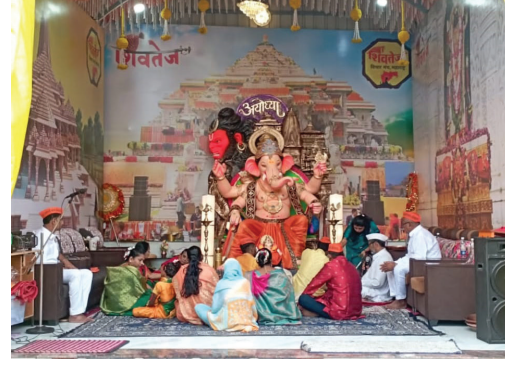
■ बाभुळवाडा येथील शिवतेज गणेश मंडळाच्या गणपती बाप्पाची प्रतिष्ठापना करण्यात आली.

पारनेर तालुक्यातील बाभुळवाडे येथील शिवतेज गणेश मंडळाच्या सदस्यांनी व पदाधिकारी यांनी शनिवार दि. ७ रोजी सकाळी नऊ वाजता शिवतेज फॉर्म हाऊस परिसरात गणेश मुर्तीची भव्य वाजत गाजत मिरवणूक काढीत दहा वाजता शिवतेज मंडळाच्या सभागृहात गणपती बाप्पाची विधीवत पूजा करीत प्रतिष्ठापना करण्यात आली. यावेळी गणपती बाप्पाच्या जयजयकाराने परिसर निनादून गेला होता.