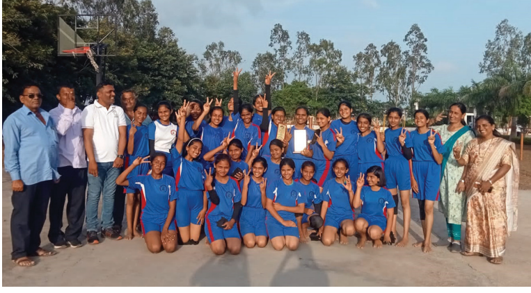
■ तालुका क्रीडा स्पर्धेत न्यू इंग्लिश स्कूल विद्यार्थ्यांनी चमकदार कामगिरी करीत यश संपादन केले.

■ तालुकास्तरीय कबड्डी स्पर्धा ■ सलग पाचव्यांदा यश