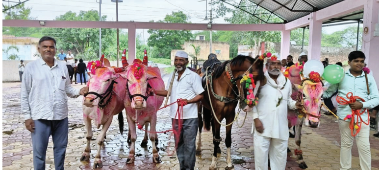
■ भोयरे गांगडां ता. पारनेर येथे श्रावणी बैल पोळा उत्साहात साजरा करण्यात आला.

बैलांची वाजत गाजत मिरवणूक | घरांना आंब्याच्या पानांची तोरणे