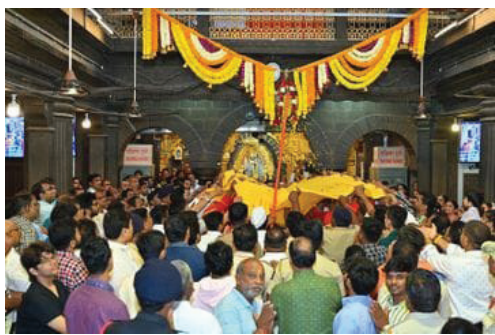
त्यानंतर श्रींची शेजारती झाली.