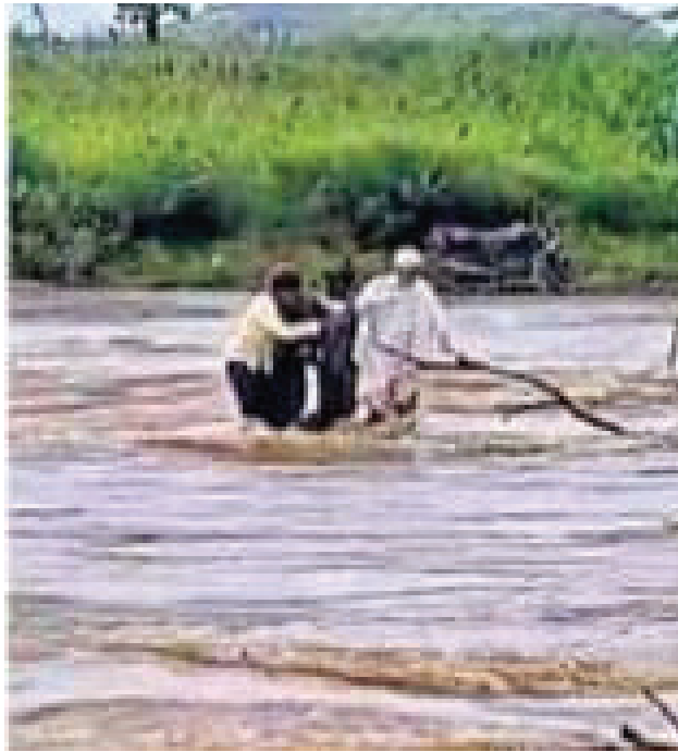
■ साक्री : प्रतिनिधी

लाडकी बहीण योजनेचा अर्ज करण्यासाठी जाणारे चार जण धुळे जिल्ह्यातील कान नदीच्या पुरात वाहून गेल्याची घटना मंगळवारी सकाळी घडली. त्यातील दोन पुरुष व