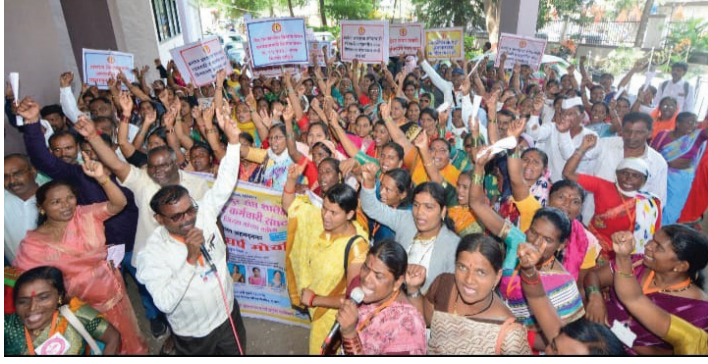
■ नगर : प्रतिनिधी

श्रमिक मजदूर संघ शालेय पोषण आहार कर्मचाऱी संघटनेतर्फे शालेय पोषण आहार कर्मचाऱ्यांच्या विविध प्रलंबित समस्या सोडवा, या