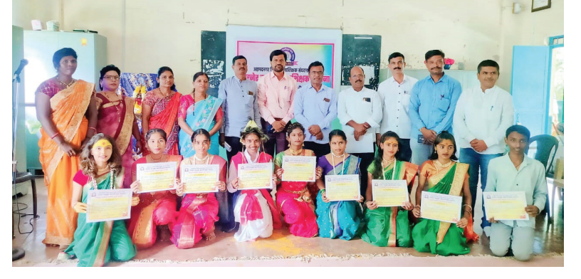
■ तालुकास्तरीय वयैक्तिक नृत्य स्पर्धेत सहभागी विद्यार्थ्यांना प्रमाणपत्र देताना पारनेर तालुका कलाशिक्षक संघटनेचे पदाधिकारी.

सहभाग घेतला तसेच विविध नृत्यांचे अफलातून सादरीकरण केले. यामध्ये लावणी, देशभक्तीपर गीते लोकनृत्य, पारंपारिक वासुदेव मारुड तसेच नवनवीन गीतांवर बालचमूनी ठेका धरला.