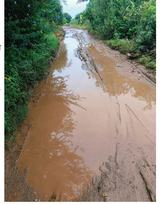
गुणोरे-घोडोबाफाटा या रस्त्याची संततधार पावसामुळे दणादणा उडली आहे.