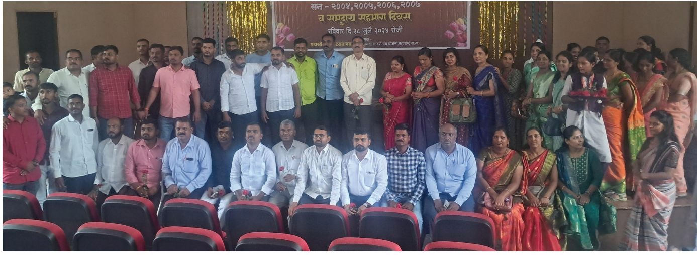
■ हिवरेबाजार : प्रतिनिधी