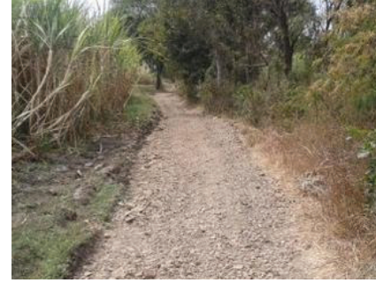
दुरुवस्था झाल्याने शेतकऱ्यांना अनेक अडचणींचा

या योजनेतर्गत रस्त्यांचे जाळे उभारणे गरजेचे आहे. शेताकडे जाणाऱ्या रस्त्यांची मोठी