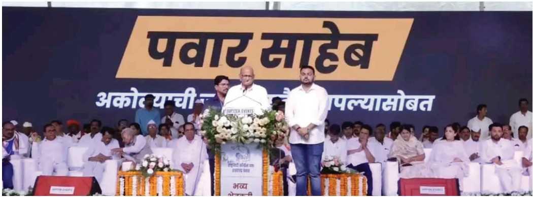
अकोले येथे पार पडलेल्या मेळाव्यात खा. शरद पवार यांनी मार्गदर्शन केले.