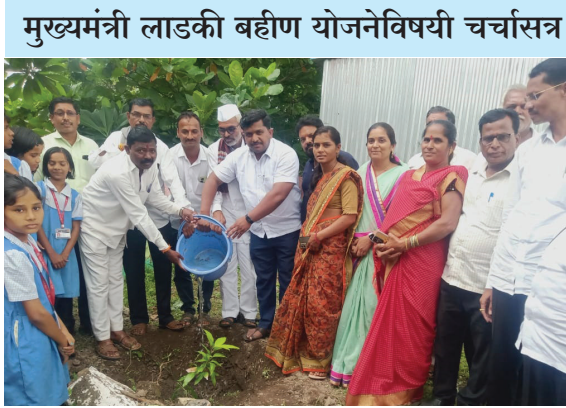
मुख्यमंत्री लाडकी बहीण योजनेविषयी चर्चासत्र

महाविकास आघाडीमध्ये पारनेर-नगर मतदारसंघाची जागा राष्ट्रवादी काँग्रेस शरद पवार गटाकडे आहे. महाविकास आघाडीतील घटक पक्ष शिवसेना उध्दव बाळासाहेब ठाकरे पक्षाने ही जागा शिवसेनेकडे घ्यावी असा आग्रह उध्दव ठाकरे यांच्याकडे धरण्यात आला असून ठाकरे हे काय निर्णय घेतात