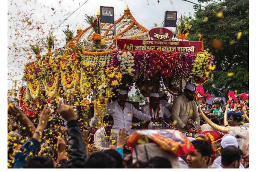
तब्बल २५ वर्षांनंतर हा मान मिळाला आहे. या बैलांची दरवर्षीप्रमाणे सवाद्य मिरवणूक काढण्यात आली.

संत ज्ञानेश्वर महाराज यांची पालखी आज पंदरीच्या दिशेने मार्गस्थ झाली. मुख्यमंत्री एकनाथ शिंदे यांच्या उपस्थितीत पालखीचे आज आळंदी येथील देऊळवाड्यातून प्रस्थान झाले. यावेळी राज्यभरातील हजारो वारकऱ्यांची उपस्थिती होती. दरम्यान, यंदा माऊलींच्या पालखीच्या बैलजोडीचा मान आळंदी गावातील कुन्हाडे कुटुंबाला मिळाला आहे. या माध्यमातून या कुटुंबाची तब्बल २५ वर्षांची प्रतीक्षा फळाला आली आहे.