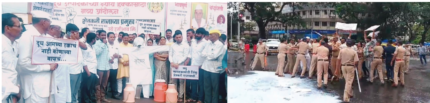
■ टाकळीहाजी येथे दूध उत्पादकांनी रस्ता रोको आंदोलन करित सरकारचे लक्ष वेधले. ■ मुंबईत विधानभवनाबाहेर शेतकऱ्यांनी रस्त्यावर दूध ओतून सरकारच्या धोरणाचा निषेध केला.

टाकळीहाजी येथे पारनेर व शिरूर तालुक्यातील शेतकरी रस्त्यावर