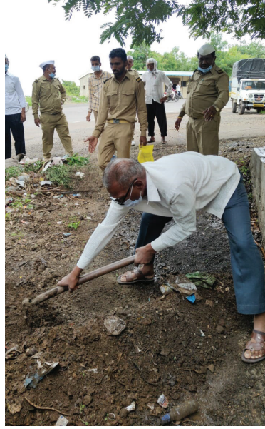
► संत निरंकारी सत्संग सोहळ्यानिमित्त पारनेर येथे निरंकारी सेवकांच्या वतीने स्वच्छता मोहिम राबविण्यात आली.

संत निरंकारी सत्संग सोहळ्याचे औचित्य साधून आयोजित करण्यात आलेल्या उपक्रमापेकी स्वच्छता अभियानांतर्गत निरंकारी सेवकांनी पारनेर शहरातील पोलीस ठाणे, भुमी अभिलेख तसेच तहसिल कार्यालयाचा परिसर स्वच्छ केले. भुमी अभिलेख परिसरातील स्वच्छतागृह देखील सेवकांनी चकाचक केले.