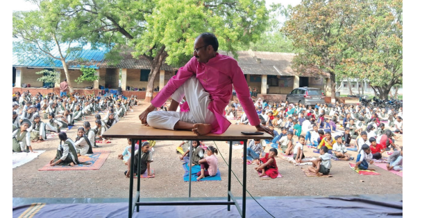
आहे. योगाचे महत्त्व जगात असून रामदेव बाबा यांनी जगात योगाची ख्याती करून देशाचा नावलौकिक वाढविण्यासाठी प्रयत्न केले आहेत.