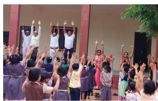
विद्यार्थ्यांनी शिक्षणाबरोबरच योग प्रशिक्षक घेण्यासाठी दिवसभरातील अमुल्य वेळ देऊन सुर्य नमस्कार करीत

योगा हा शरीर तंदुरुस्त राहण्यासाठी सर्वोत्तम पर्याय असून