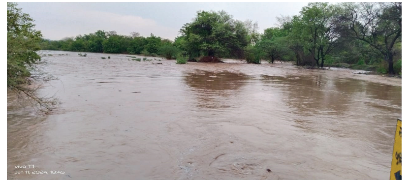
रुईछत्रपती ता. पारनेर येथील हंगा नदी मंगळवारी सायंकाळी झालेल्या पावसाने दुधडी भरून वाहू लागली.

पारनेर तालुक्यात एक दिवस विश्रांतीनंतर आज मंगळवार दि. ११ रोजी पावसाने जोरदार हजेरी लावली. ढगफुटी सदृश्य पावसाने ओढे नाले ओसंडून वाहू लागले. तर शेतकऱ्यांच्या शेतात मुगार पडल्याने माती वाहून गेल्याने मोठे नुकसान झाले.