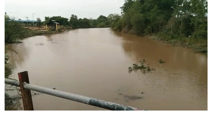
सुपा येथे रविवारी सायंकाळी पावसाने जोरदार हजेरी लावली.

सुपा : प्रतिनिधी पारनेर तालुक्यातील बहुतेक ठिकाणी जिरायती पट्टयात रविवार दि. ९ रोजी पावसाने जोरदार हजेरी लावल्याने बळीराजा सुखावला आहे. रोहिणी नक्षत्र कोरडे गेल्यानंतर प्रथमच पावसाने हजेरी लावल्याने खरीप हंगामातील पेरणीला आता वेग येणार आहे. तर सलग दुसऱ्या दिवशी झालेल्या जोरदार पावसाने पाण्याचा प्रश्न काही अंशी निकाली निघणार आहे.