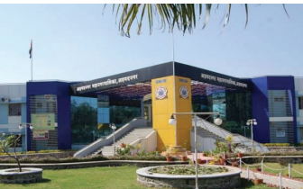
महापालिकेतील मंजूर असलेल्या दोन हजार ८७१ पदांपैकी दीड हजाराने अधिक पदे रिक्त आहेत. जून महिन्यात आणखी काही कर्मचारी निवृत्त होणार आहेत. तांत्रिक कर्मचारींची कमतरता

नगर : प्रतिनिधी लोकसभा निवडणुकीची आचारसंहिता संपताच महापालिकेच्या रखडलेल्या कर्मचारी भरती प्रक्रियेला वेग आला आहे. महाराष्ट्र शासनाच्या निर्देशानुसार टाटा कन्सल्टन्सी सर्विसेस मार्फत ही प्रक्रिया राबवली जाणार आहे. त्यामुळे कर्मचारी भरती संदर्भातील प्रक्रिया लवकरच सुरु होण्याची संकेत आहेत.