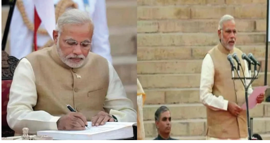
नवी दिल्ली : वृत्तसंस्था

विद्यमान काळजीवाहू पंतप्रधान नरेंद्र मोदींनी बुधवारी पंतप्रधानपदाचा राजीनामा देशाच्या राष्ट्रपती द्रौपदी मुर्मू यांच्याकडे सोपवला. द्रौपदी मुर्मू यांनी त्यांचा राजीनामा स्वीकारला असून नरेंद्र मोदी यांची नव सरकार स्थापन होईपर्यंत काळजीवाहू पंतप्रधान म्हणून कायम राहण्याचे आवाहन केले आहे.