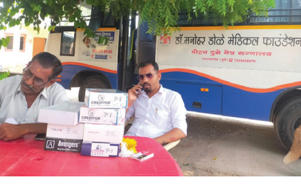
■ रांधुबाई देवस्थान ट्रस्टच्या वतीने मोफत नेत्र तपासणी शिबिराचे आयोजन करण्यात आले होते.

तालुक्यातील रांधे येथील रांधुबाई देवस्थान ट्रस्टच्या वतीने मोफत नेत्र तपासणी शिबिराचे आयोजन करण्यात आले होते. या शिबिरात १५४ रूग्णांची नेत्र तपासणी करण्यात येऊन ३० रूग्णांवर अल्पदरात शस्त्रक्रिया करण्यात येणार असल्याचे देवस्थानच्या विश्वस्तांकडून सांगण्यात आले.