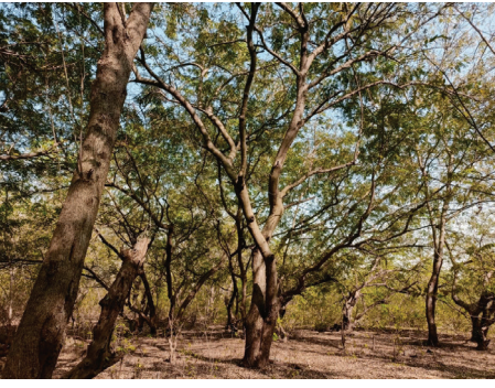
■ शिरसुले येथील गायऱान जमिनीवर सरासरी ३० ते ४० वयाची, २५ ते ३० हजार झाडे उभी आहेत.