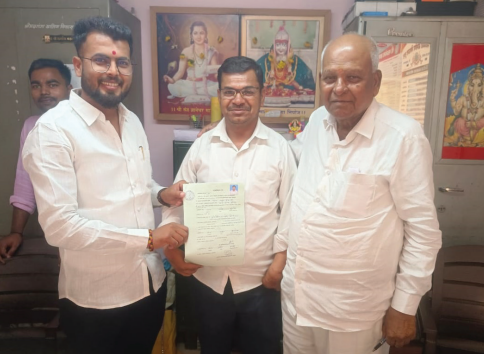
■ मळगंगा विकास ट्रस्टच्या निवडणुकीसाठी अखेरच्या दिवशीही उमेदवारी अर्ज दाखल करण्यात आले.

राज्यातील लाखो भाविकांचे श्रद्धास्थान असलेल्या निघोज येथील मळगंगा देवस्थानच्या मळगंगा ग्रामीण विकास ट्रस्टच्या विश्वस्तांच्या निवडीसाठी निवडणूक प्रक्रिया राबविण्यात येत असून अर्ज दाखल करण्याच्या शेवटच्या दिवशी ८७ उमेदवारांनी अर्ज दाखल केले आहेत. ट्रस्टच्या स्थापनेनंतर ४२ वर्षानंतर विश्वस्त निवडीसाठी प्रथमच निवडणूक होत आहे. आतापर्यंत सर्व निवडी बिनविरोध करण्यात येत होत्या.