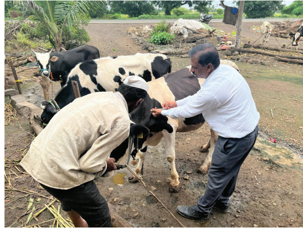
निघोज परिसरात पशुसंवर्धन विभागामार्फत जनावरांच्या लसीकरणची मोहिम हाती घेण्यात आली आहे.

पावसाळ्याच्या पार्श्वभूमीवर जनावरांना होणाऱ्या संभाव्य लम्पी तसेच पीपीआर आजारांबाबत पशुसंवर्धन विभाग सतर्क झाला असून निघोज पशुवैद्यकीय दवाखान्याच्या कक्षेत येणाऱ्या ११ हजार ३९७ जनावरांच्या लसीकरणची मोहिम हाती घेण्यात आली आहे. या मोहिमेदरम्यान या आजारांबाबत पशुपालकांमध्ये जनजागृतीही करण्यात येणार आहे.