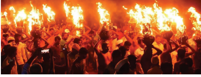
अकोले : प्रतिनिधी

कठ्याच्या यात्रेमुळे गाव सर्वदूर प्रसिद्ध