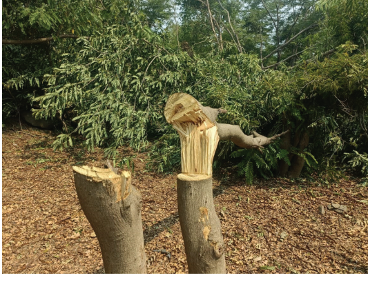
जलशुध्दीकरण प्रकल्प उभारण्यासाठी शिरसुले येथील ८२० झाडांची कत्तल करण्याचा घाट घातला जात आहे.

बेसुमार वृक्षतोडीमुळे निसर्गाचे संतुलन बिघडले असून अनेक नैसर्गिक आपत्तींना तोंड द्यावे लागत आहे. तापमानातही मोठ्या प्रमाणावर वाढ झाली आहे. त्यावर मात करण्यासाठी शिरसुले ग्रामस्थांनी गट क्र.१४३ मध्ये ८२० झाडांचे संगोपन करून ही झाडे वाढविली आहेत. वनसंपदेमुळे या भागात भारताचा राष्ट्रीय पक्षी मोर, लांडोरांची संख्याही मोठ्या संख्येने येथे पहावयास मिळते.