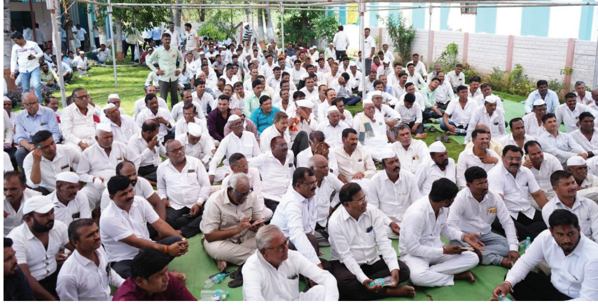
■ मळगांग ग्रामीण विकास ट्रस्टच्या सभेस निघोजकरांनी मोठया संख्येने हजेरी लावली होती.